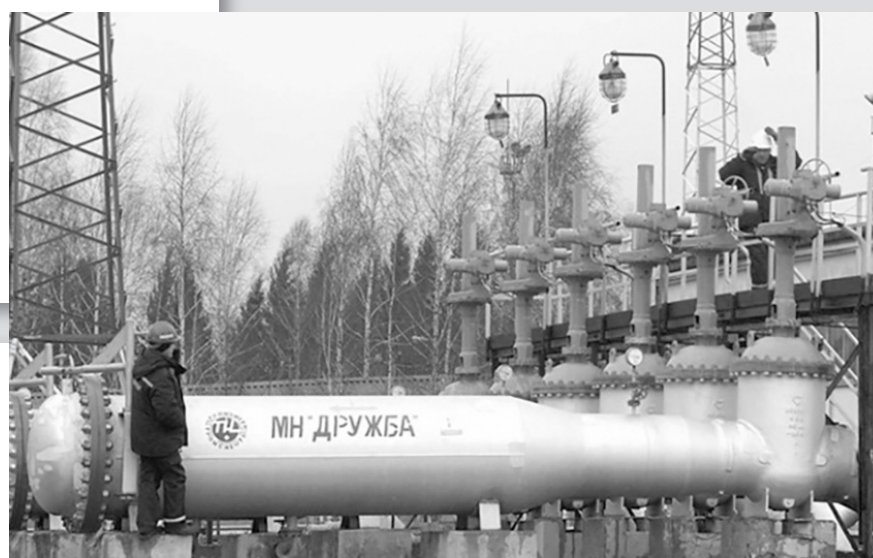
Avropa Komissiyası hazırda müəkkəb seçim qarşısındadır. Bir tərəfdən Ukraynanın

Enerji böhranı Avropa daxilində siyasi parçalanmanı da gücləndirir. Almaniya və Fransa alternativ enerji mənbələrinə keçidi sürətləndirməyi dəstəklədiyi halda Mərkəzi Avropa dövlətləri keçid prosesinin daha mərhələli aparılmasını tələb edir. Almaniyanın iqtisadiyyat və iqlim naziri Robert Habeck bildirdi ki, bərpa olunan enerji layihələri sürətlə genişlənsə də, səmərə iqtisadiyyatı hələ uzun müddət sabit neft və qaz tədarükünə ehtiyac duyacaq. Eyni zamanda, enerji bazarında qiymət dalğalanması yenidən müşahidə olunmağa başlayıb. Yanvar hadisələrindən sonra Avropa birləşmələri Brent markalı neftin qiyməti qısa müddətdə 5-7 faiz artdı. Analitiklər bunu fiziki çatışmazlıqdan daha çox bazarın psixoloji reaksiyası kimi qiymətləndirirlər, çünki enerji bazarları artıq hərbi və siyasi xəbərlərə bərabər həssasdır. Maraqlıdır ki, ABŞ və Ya-